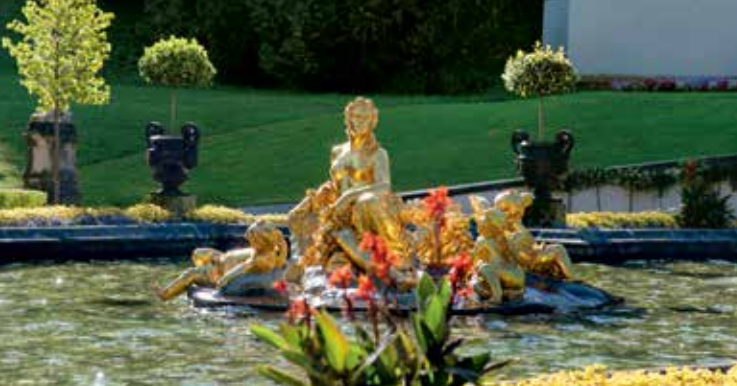
Figurengruppe des Flora-Springbrunnens vor dem Königsschloss