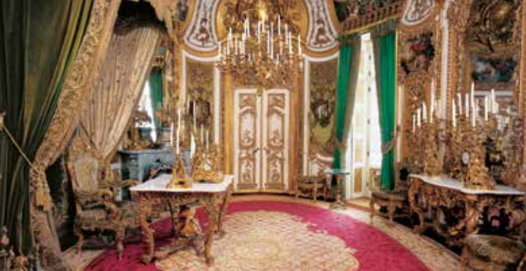
Audienz- oder Arbeitszimmer des Königsschlusses

Bayerischer Staatsminister der Finanzen, für Landesentwicklung und Heimat