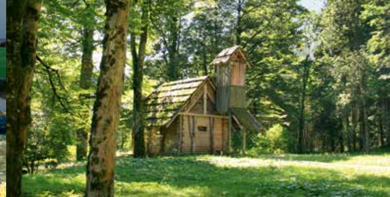
Außenansicht der Einsiedlerhütte des Gurnemannz