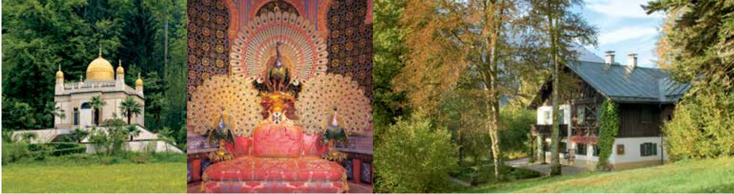
Außenansicht des Maurischen Kiosks im Park (li.); Ludwigs fantastischer Pfauenthron im Inneren des Maurischen Kiosks (re.)